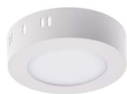
LED PANEL PL6W