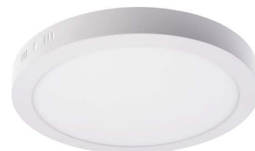
LED PANEL PL24W