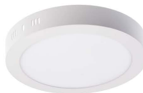
LED PANEL PL18W